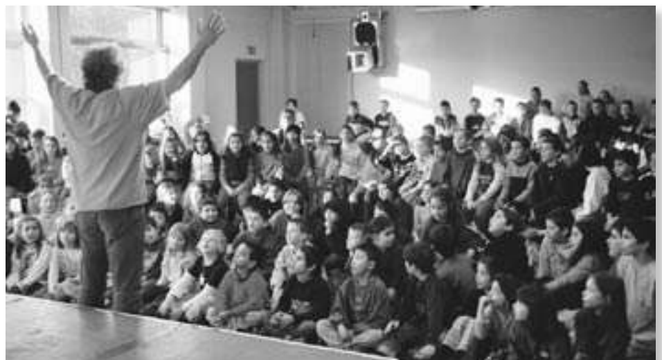
Kinder und Jugendliche im M9 – lesen Sie dazu den Bericht auf Seite 2