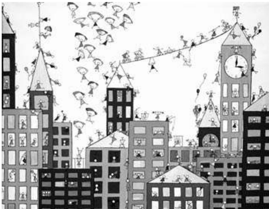
ab 4. April zu sehen: „Tausend und ein Männchen und mehr“