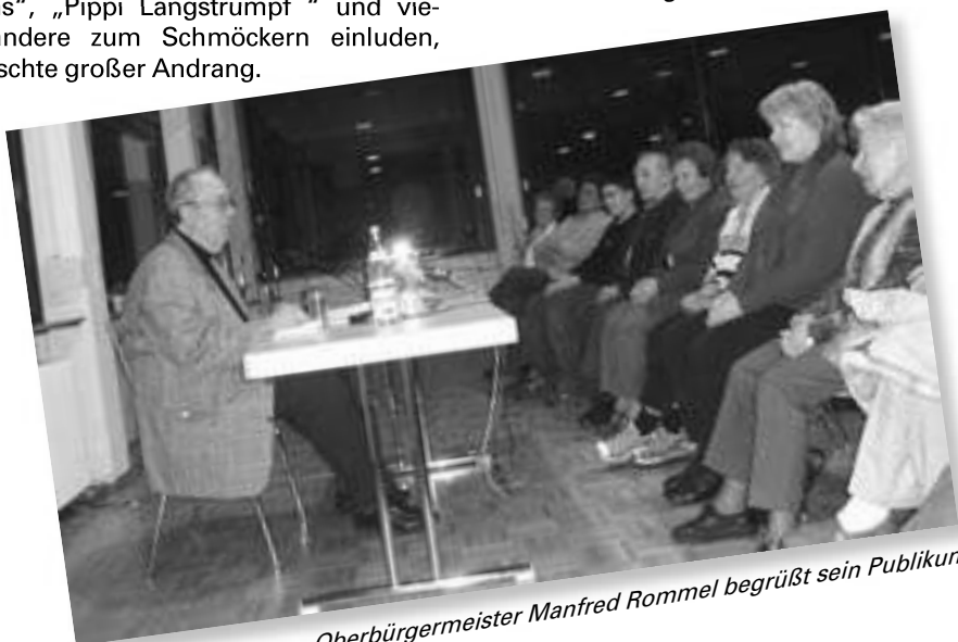
Oberbürgermeister Manfred Rommel begrüßt sein Publikum

Einen echten Höhepunkt des Abends bildete die Lesung des Alt-OB Manfred Rommel aus seinem neuesten Buch „Das Land und die Welt“. Er begeisterte das Publikum mit Anekdoten rund um die schwäbische Eigenart, die Politik, d e n