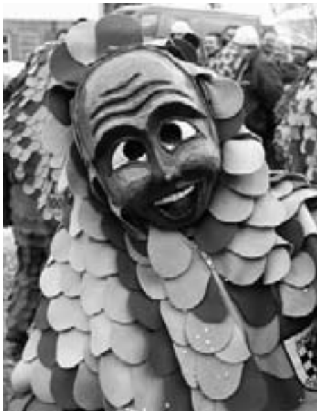
Scillamännle aus Hofen

Narri Narro! Feucht-fröhlich wird's zur bunten Fasnetszeit in der Cafeteria beim Bürgerverein Freiberg und Mönchfeld im Bürgerhaus. Das sollten Sie auf keinen Fall verpassen. Denn wie bereits im letzten Jahr, so gibt es auch 2006 wieder jede Menge lohnender Attraktionen in der Adalbert-Stifter-Straße.