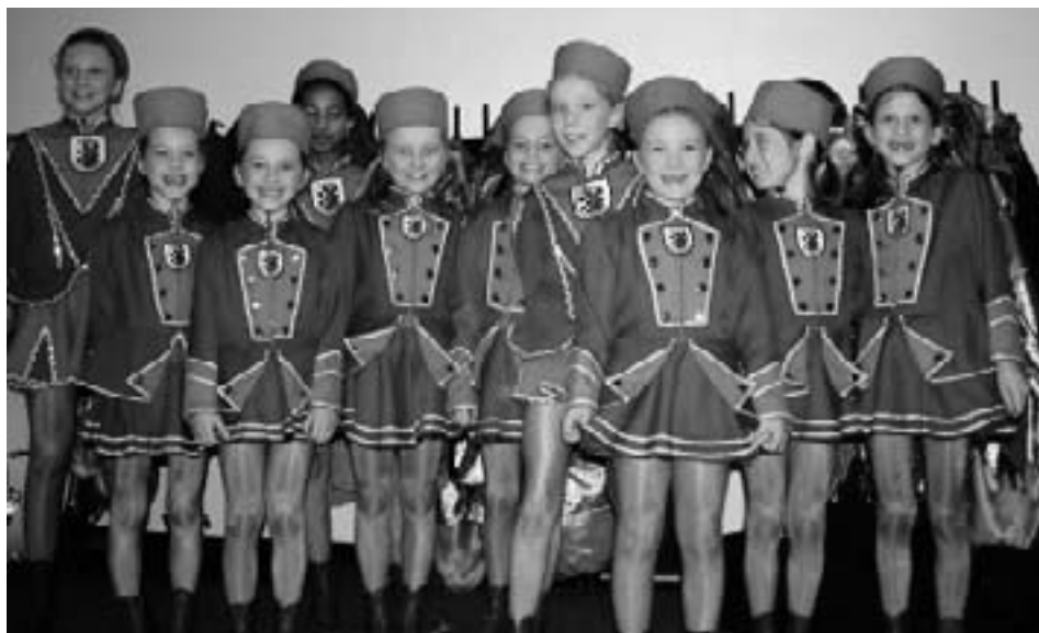
Eine Augenweide: Die süße Nachwuchsgarde der Hofner Scillamännle

Doch damit nicht genug, denn am 2. März um 15.30 Uhr findet bereits ein weiteres Spektakel statt. Auch diesmal wird Ihrem Auge richtig was geboten, denn wir begeben uns auf eine wunderschöne Reise in den Orient. Die Tanz-