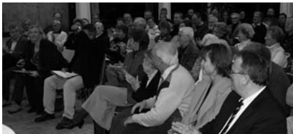
Hundert Gäste versammelten sich im Bürgerhaus, um den Abschlussberichten der Arbeitskreise zu lauschen